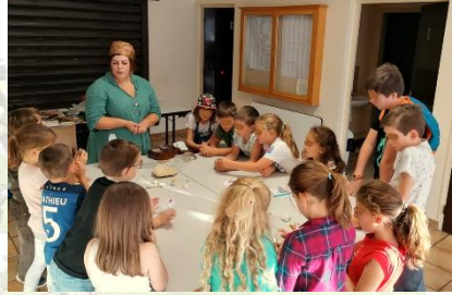
Faites de la science