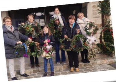
Création de couronnes de Noël

TANT DE CHOSES FAITES ET À FAIRE ENSEMBLE !